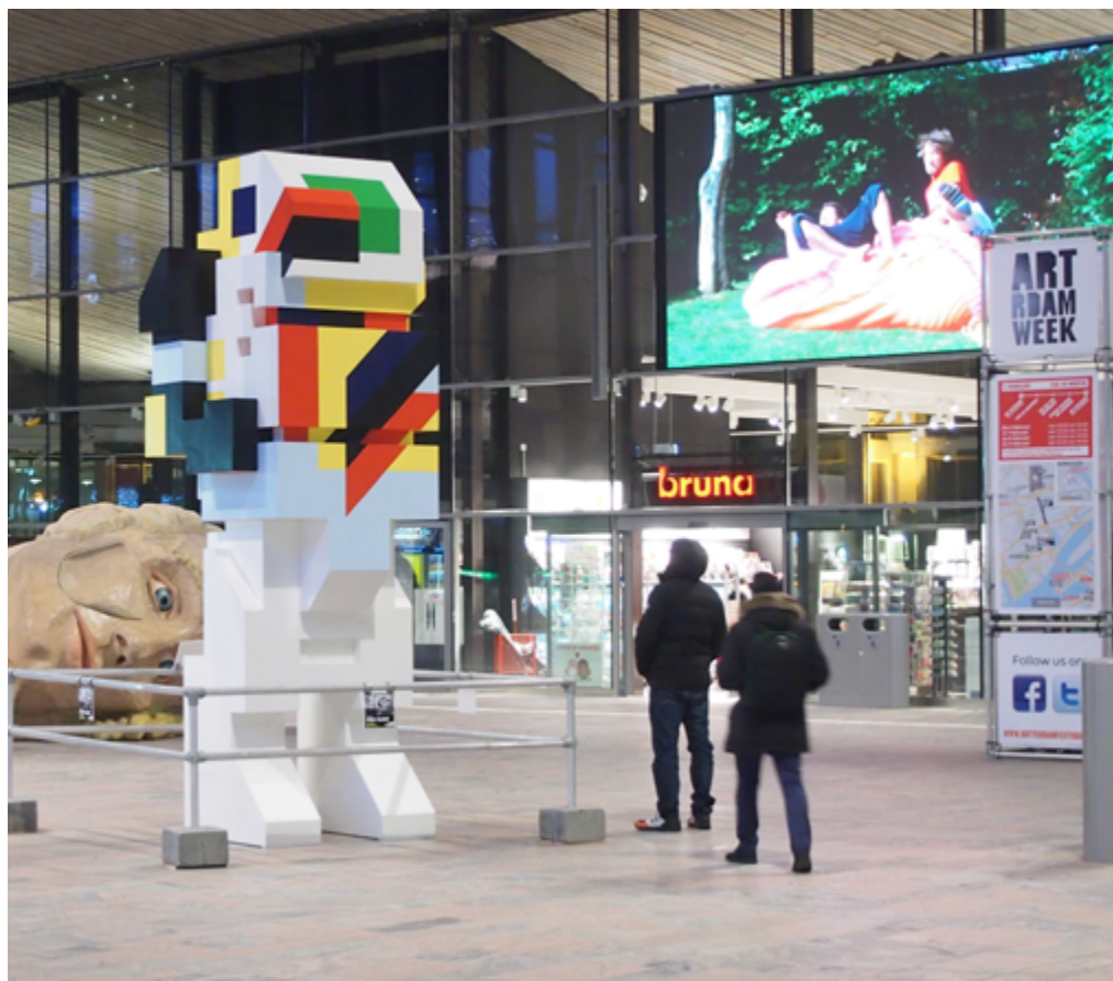
Boris-Tellegen, «Delta R'damCS», 2014

La présentation de la collection pourra s'adapter aux expositions temporaires pour leur apporter un cadre historique supplémentaire.