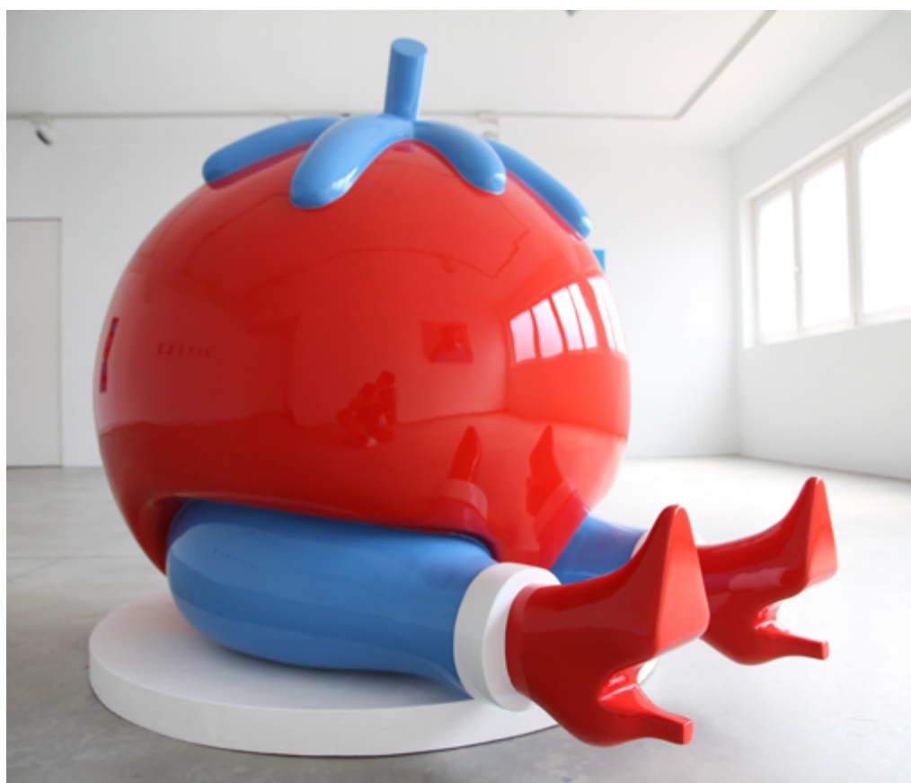
'Give Up' by Parra

Désigné parfois comme art urbain, l'expression artistique du millénaire multiplie volontiers les expériences créatives hors galerie. À l'image de Parra, l'artiste hollandais auteur du logo du MIMA et skateboarder, créateur de vêtements (TIREN), plasticien, graphiste, réalisateur de clip vidéo et musicien (« LE LE »), dont chaque projet porte sa signature artistique et lui adjoint un nouveau public.